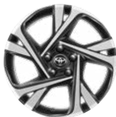
18" fekete, csiszolt hatású könnyűfém keréktárcsa (5 dupla küllős) Széria a Style modellváltozatokon