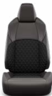
Orchidea-mintás steppelt szövetkárpit, bőr betétekkel Széria az Executive modellváltozaton