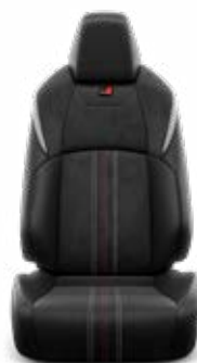
Fekete Alcantara kárpit, bőr betétekkel, szaténkróm színű díszcsíkkal Széria a GR SPORT modellváltozaton