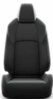
Fekete szövetkárpit, világosszürke varrással Széria a Comfort modellváltozaton