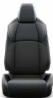
Fekete & sötétszürke szövet ülésborítás bőr betétekkel Széria a Style modellváltozaton