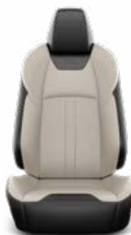
Grézs színű bőr kárpit Széria az Executive VIP modellváltozaton