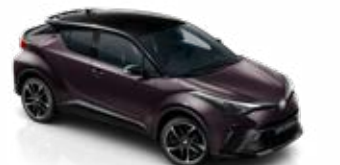
2XE Mély ametisztlila / fekete tető metálfényezés csak a GR SPORT változatban rendelhető