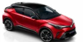
2TB Érzéki vörös / fekete tető különleges fényezés csak a GR SPORT változatban rendelhető