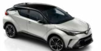
2VF Nikkelszürke / fekete tető metálfényezés csak a GR SPORT változatban rendelhető