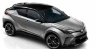
2VU Prémiumezüst / fekete tető különleges fényezés csak a GR SPORT változatban rendelhető