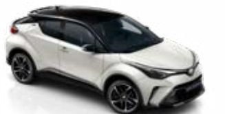
2VP Platina gyöngyfehér / fekete tető gyöngyház fényezés csak a GR SPORT változatban rendelhető