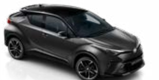
2NB Hamuszürke / fekete tető metálfényezés csak a GR SPORT változatban rendelhető