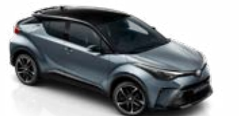
2TH Szürkéskék / fekete tető metálfényezés csak a GR SPORT változatban rendelhető