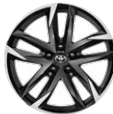
19" GR SPORT könnyűfém keréktárcsa (10 dupla küllős) Széria a GR SPORT modellváltozaton