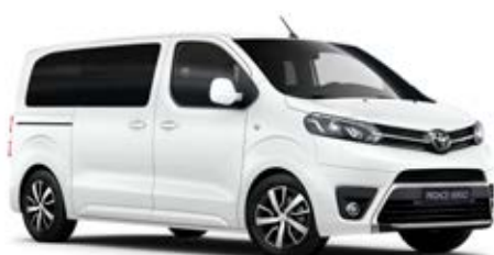
EPR Hófehér felár nélkül