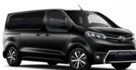
KTV Éjfekete Metálfényezés Bruttó 200 000 Ft