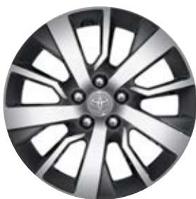
17" könnyűfém keréktárcsák