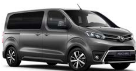
EVL Súlyomszürke Metálfényezés Bruttó 200 000 Ft