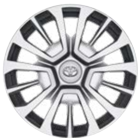
16" / 17" acél keréktárcsák dísz tárcsával