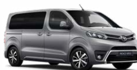
KCA Ezüst Metálfényezés Bruttó 200 000 Ft