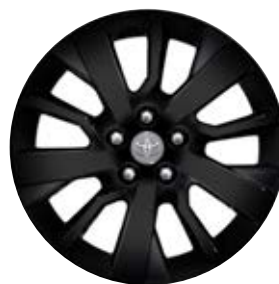
17" fekete könnyűfém keréktárcsák