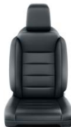
Fekete bőr Alapfelszereltség VIP modelleken