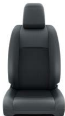
Fekete szövet ülésborítás Alapfelszereltség Combi modelleken