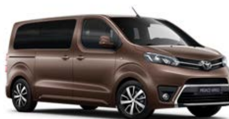
KCM Gesztenye barna Metálfényezés Bruttó 200 000 Ft

A karosszéria színe a felszereltségi szinttől is függhet.