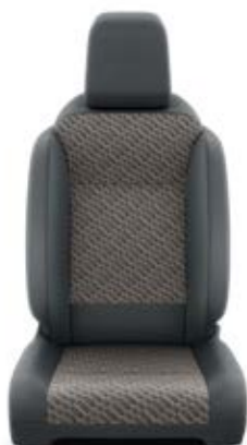
Fekete szövet barna betétekkel Alapfelszereltség Family modelleken