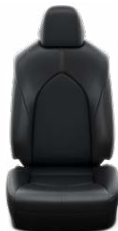
Fekete bőr ülésborítás Alapfelszereltség az Executive modellváltozatnál