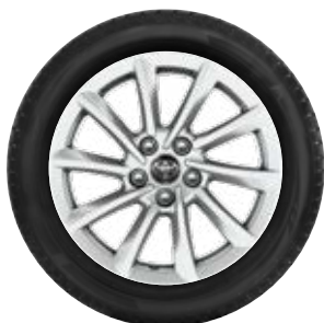
17"-os könnyűfém keréktárcsa, 215/55 R17 98H XL Continental Wintercontact TS870P téli gumiabroncs