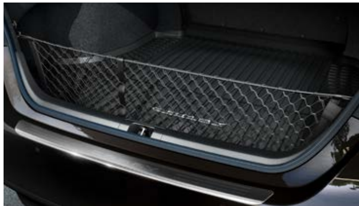
Csomagrögzítő háló 35700 Ft