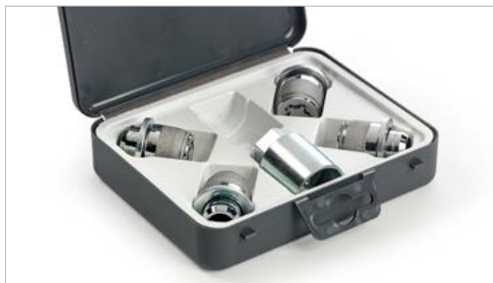
Kerékőr 26000 Ft