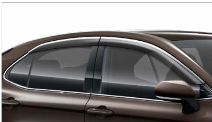
Ablaklégtérelő szett 138900 Ft