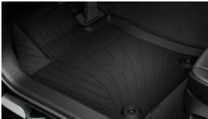
Gumiszőnyeg garnitúra 74100 Ft