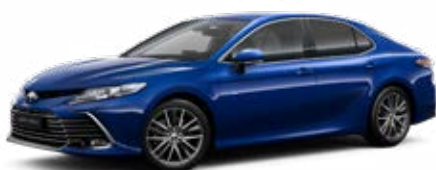
8W7 Kobalt kék* 200 000 Ft