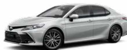
1F7 Ultraezüst* 200 000 Ft