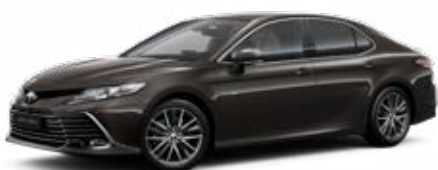
4X7 Grafit szürke* 200 000 Ft