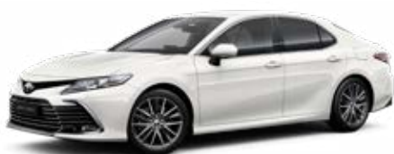
040 Hófehér felár nélkül