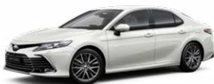
089 Platina gyöngyfehér** 300 000 Ft