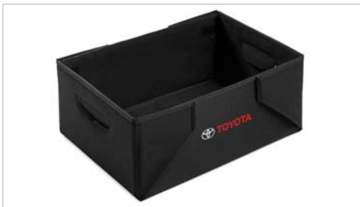
Összecsukható tárolódoboz 36700 Ft