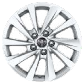
17" könnyűfém keréktárcsák 215/55 R17 gumiabroncsokkal Alapfelszereltség a Comfort modellváltozatnál