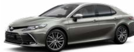
1L5 Sötétszürke* 200 000 Ft