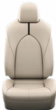
Bézs színű bőr ülésborítás Alapfelszereltség az Executive modellváltozatnál