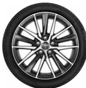
18"-os könnyűfém keréktárcsa, 235/45R18 98V Bridgestone LM005 téli gumiabroncs

Autójához vásárolt téli szerelt kerekek mellé 3 évig tartó (a nyári gumiabroncsra is vonatkozó) gumibiztosítást adunk ajándékba! Az árakkal és a további részletekkel kapcsolatban érdeklődjön márkakereskedőjénél!