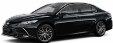
218 Fekete gyöngyház* 200 000 Ft