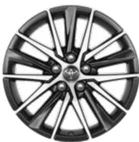
18" csiszolt hatású könnyűfém keréktárcsák 235/45 R18 méretű gumiabroncsokkal Alapfelszereltség a Prestige és az Executive modellváltozatoknál