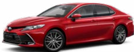
3U9 Érzéki vörös** 300 000 Ft