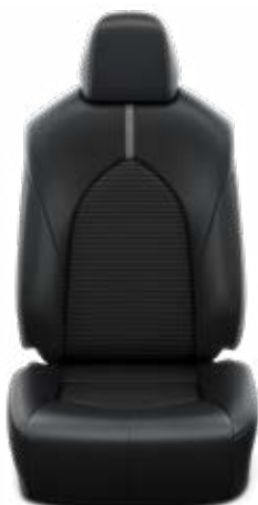
Fekete szintetikus bőr ülésborítás szövet betétekkel Alapfelszereltség a Prestige modellváltozatban