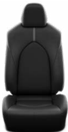
Fekete szövet ülésborítás Alapfelszereltség a Comfort modellváltozatnál